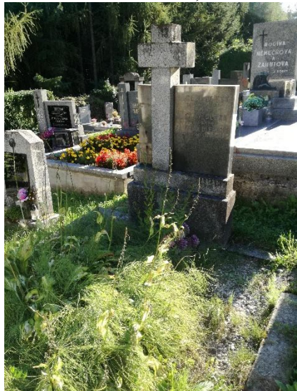
Hrobové místo č. A 20 /39,40/ Zemřelí: Václav Dlesk, Kateřina Dlesková