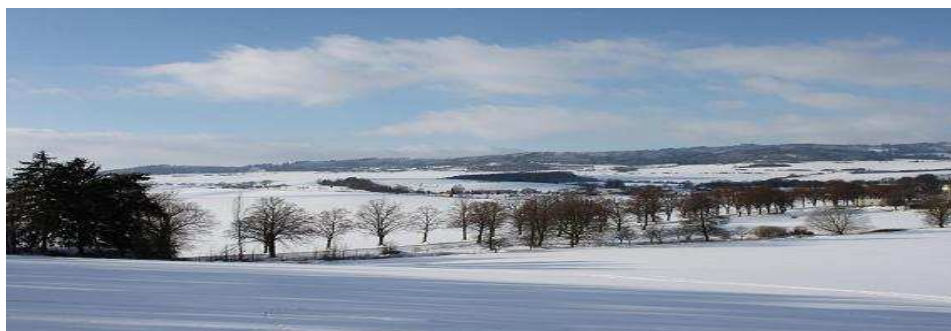
Pohled na Koryta a Struhadlo

Když na Hromice sněží a je větrno, není jaro již vzdáleno.